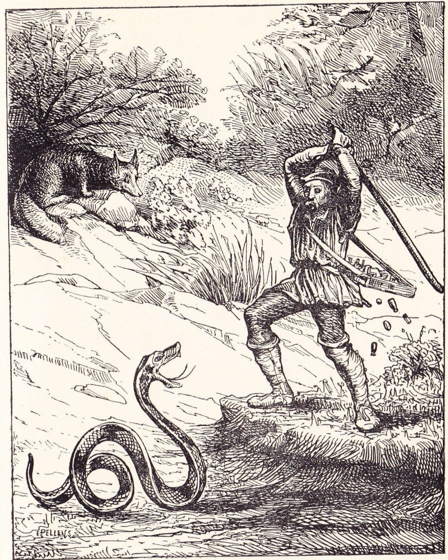
De kramer sloeg er fluks op los (bladz. 50)